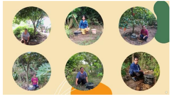
๓.๕ ตำบลบ่อทราย วันที่ ๒๓ พฤศจิกายน ๒๕๖๕ เวลา ๐๙.๓๐ น. ณ ที่ทำการกำนันตำบลบ่อทราย