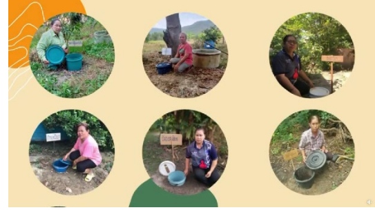
๓.๕ ตำบลไผ่เขียว วันที่ ๒๒ พฤศจิกายน ๒๕๖๕ เวลา ๑๐.๐๐ น. ณ ที่ทำการกำนันตำบลไผ่เขียว